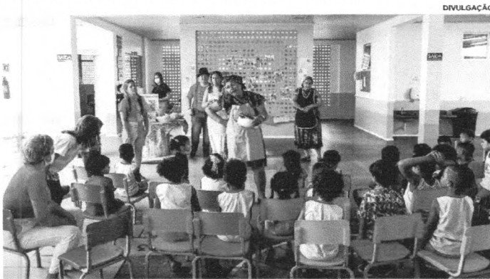
Creche da Liberdade promoveu diversas atividades artísticas para as crianças

Com o intuito de fortalecer a arte literária no Maranhão, a Secretaria de Estado da Educação (Seduc) deu início, na segunda-feira (18), à Quinzena do Livro Infantil. A ação será realizada em diversos municípios e segue até o dia 29 de abril. O evento é alusivo ao Dia Nacional do Livro Infantil, comemorado no dia 18 de abril, em homenagem ao escritor de literatura infantil Monteiro Lobato, e ao Dia Internacional do Livro Infantil e Juvenil, que homenageia o também escritor Hans Christian Andersen, comemorado no dia 2 de abril. "Estamos com diversas atividades culturais e de estímulo à leitura, em São Luís e outros municípios. Faremos, até o dia 29 de abril, desenvolvendo atividades com o objetivo de movimentar a comunidade escolar, e os moradores no entorno da escola, para o uso das bibliotecas que estão disponíveis com bons livros e que são importantes para construção de novos leitores", destacou a superintendente da Seduc, Adelaide Diniz. Em São Luís, a cerimônia de abertura da Quinzena do Livro Infantil aconteceu no Centro Integral de Educação Infantil Creche da Liberdade, com acolhida e boas-vindas; apresentação da peça, de autoria de Monteiro Lobato, "A pílula falante"; contação de História - O coelho; cantigas - Música do Jacaré, entre outras atividades. A gestora pedagógica da Creche da Liberdade, Lillian Valéria Rodrigues Lemos Soares, ressaltou a importância da Quinzena do Livro Infantil, para estimular a leitura dos